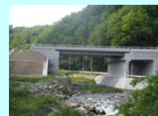
うたがわばし 宇多川橋