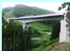
ものくらばし 物倉橋