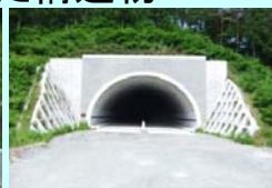
まつがぼう 松ヶ房トンネル