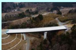
どうきりばし 胴切橋