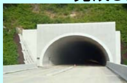
ならばい 榑這トンネル