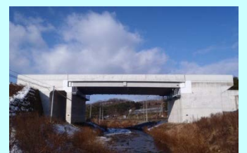
たまのがわばし 玉野川橋