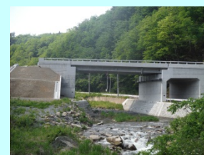
うたがわばし 宇多川橋