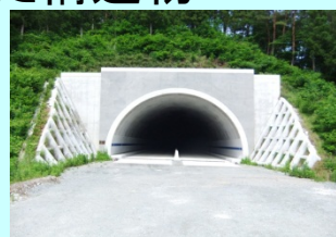
まつがぼう 松ヶ房トンネル