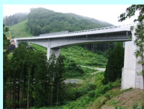
ものくらばし 物倉橋