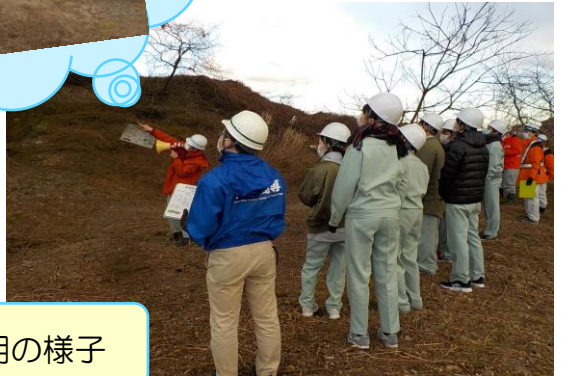
現場での説明の様子