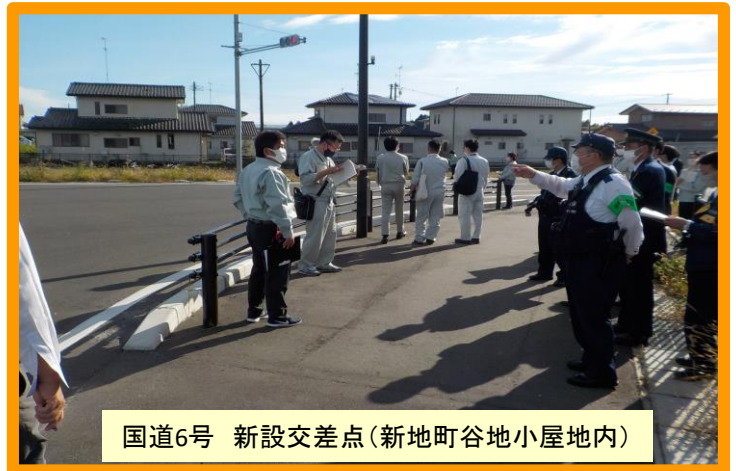
国道6号 新設交差点(新地町谷地小屋地内)