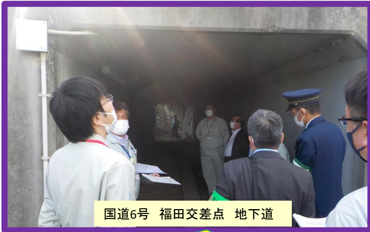
国道6号 福田交差点 地下道