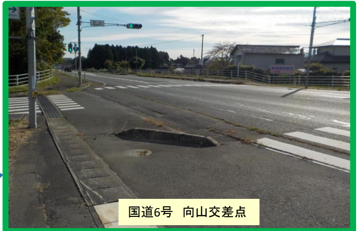
国道6号 向山交差点

日中も地下道が暗く、日中でも通るのが怖い。 雨が降ると雨水が溜まる。 【対策】⇒電灯を日中でも点灯する 排水が十分にされるよう工事する