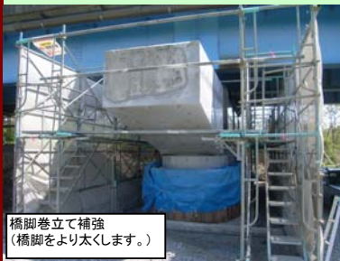
橋脚巻立て補強 (橋脚をより太くします。)

管内の橋梁は、昭和30～40年代に建設されたものが多く、今後高い確率で発生するとされている宮城県沖地震で被災した場合、損傷、落橋により緊急輸送路が分断され、地域の社会・経済活動に大きな支障が出る恐れがあります。そのため、落橋を防止する装置の設置、巻立てによる橋脚の補強を行い、橋梁の耐震性の向上を図ります。補強工事によって、緊急輸送路としての機能が向上し、大規模地震時の安全性及び信頼性が高まります。