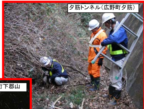
夕筋トンネル(広野町夕筋)

法面の点検作業の様子です。亀裂などコンクリート面に異常がないか細部まで点検しました。