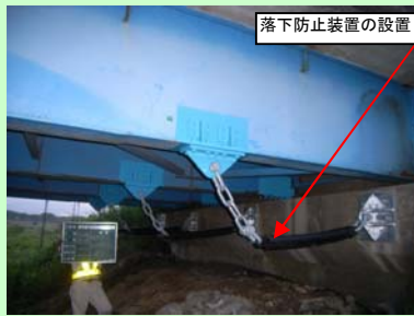
落下防止装置の設置