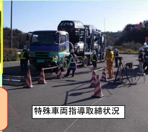
特殊車両指導取締状況