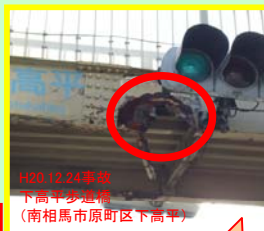
H20.12.24事故 下高平歩道橋 (南相馬市原町区下高平)