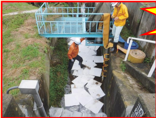
▲オイル吸着マットの設置