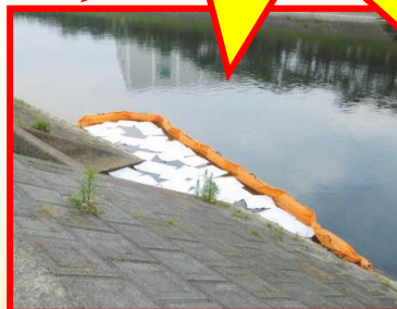
▲オイルフェンスの設置