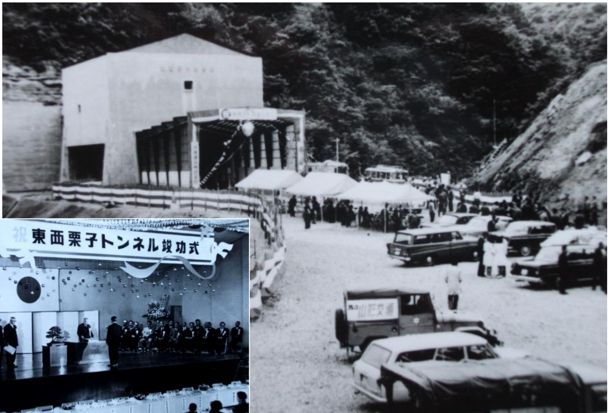
現国道13号東西栗子トンネル竣工式(昭和41年5月29日)