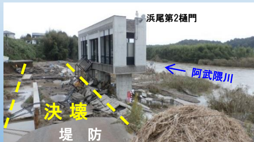
98.6k 左岸堤防決壊箇所(須賀川市)