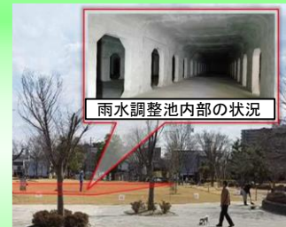
下水道事業による雨水貯留施設の例(郡山市)