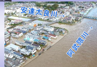
本川・支川合流部(本宮市)