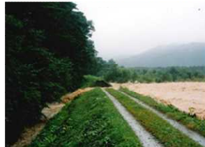
荒川の破堤の様子(日之倉橋上流右岸)