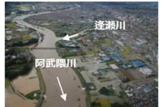
計画高水位を超過した郡山市

日時：2019年7月24日(水) 13:30 ~ 16:45 (13:00 開場)