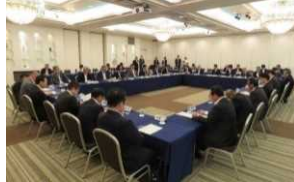
阿武隈川改修100周年実行委員会 沿川22市町村の首長等により構成

▶「阿武隈川改修100周年事業実行委員会 設立総会」 (減災協議会メンバーをベースに、県管理区間自治体も含めて実行委員会を立上げ)