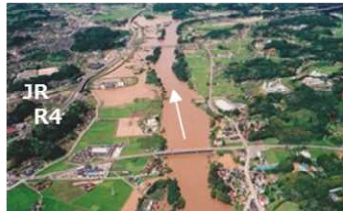
国道4号が浸水、JRに影響した二本松市内