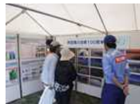
防災展の様子 (総合水防演習)