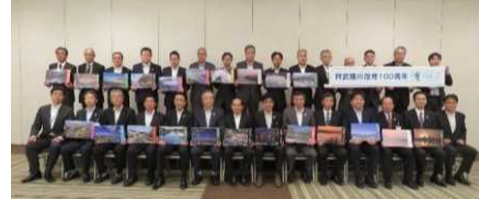
沿川22市町村の阿武隈川カードデザインのお披露目