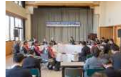
座談会 (阿武隈川上流地区)