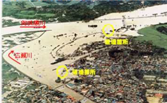
家屋の浸水被害が発生した伊達市梁川町内