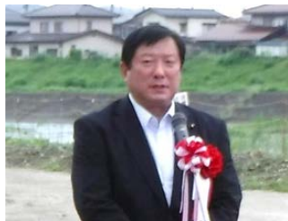
亀岡衆議院議員による挨拶