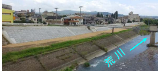
荒川嵩上工事完成全景