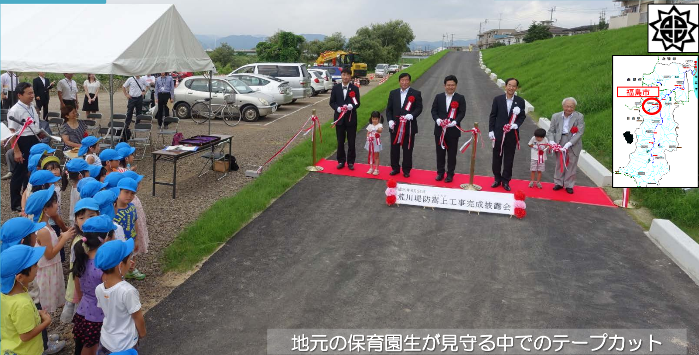
地元の保育園生が見守る中でのテープカット