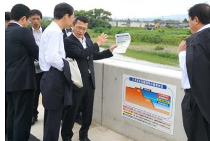
新設の水位表示板について福島市長に説明