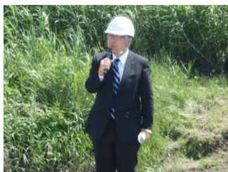
品川郡山市長の挨拶

大雨や台風などの出水時に迅速な内水排除対応ができるよう、郡山市と合同で排水ポンプ車の設置・操作訓練を実施し、連携強化と作業のスキルアップを図りました。