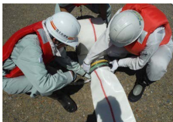
訓練状況（ホース設置）