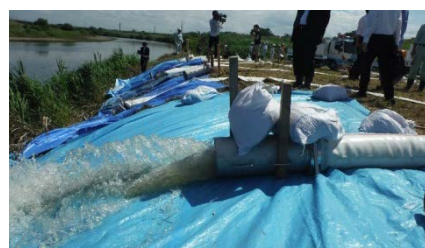
訓練状況（排水作業）