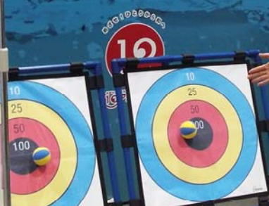
水害ゾーン「水災害を知ろう」のブースの様子