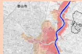
最新の浸水想定区域図(L2)