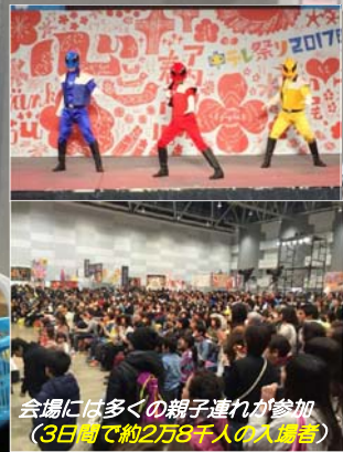
会場には多くの親子連れが参加 (3日間で約2万8千人の入場者)