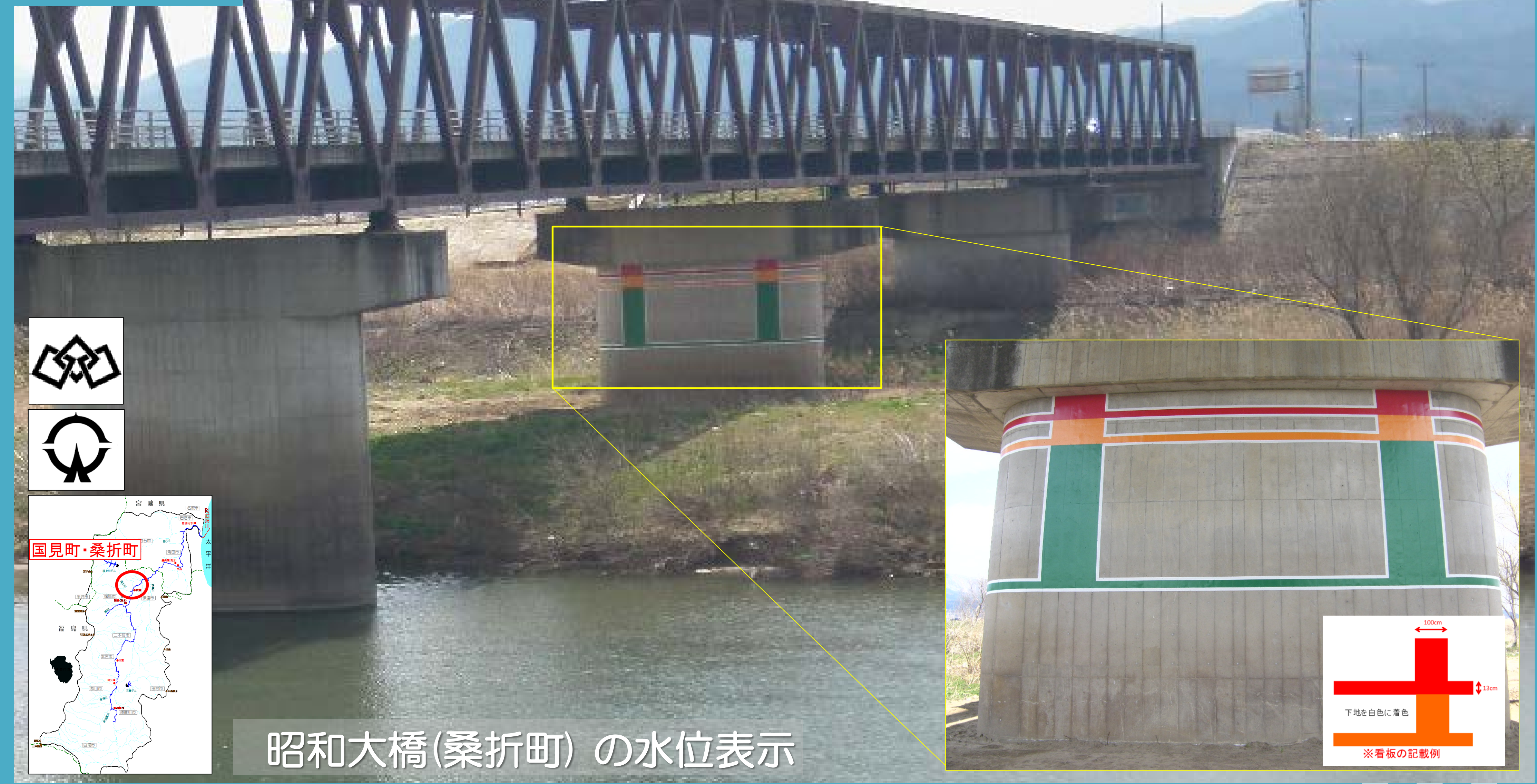
昭和大橋(桑折町) の水位表示