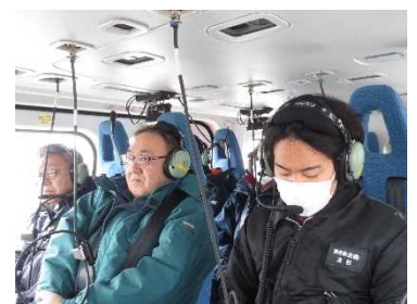
「みちのく号」での視察