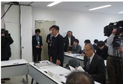
秋田河川国道事務所長の挨拶

会議終了後、国土交通省災害対策用ヘリコプター「みちのく号」で子吉川河口、河道掘削(二十六木地区)、鳥海ダム建設現場を上空から視察しました。