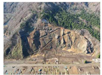
③左岸上部掘削及び仮締切工事 施工状況