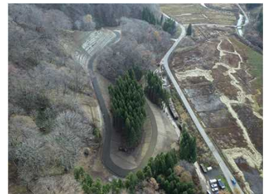
⑥杉峠地区工事用道路工事 完了状況