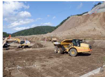
②右岸上部掘削整備工事 施工状況