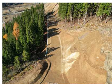
⑤付替道路天配地区道路改良工事 完了状況