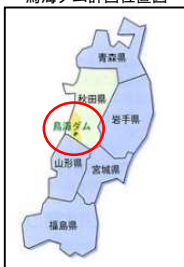
鳥海ダム計画位置図