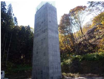
④百宅線4号橋下部工工事 完了状況