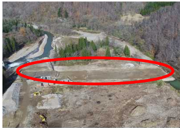
①仮締切(地中壁)工事 下流側完了状況

令和6年度は、いよいよダム本体工事が着工されます。本格的に工事現場が稼働することになりますが、引き続き、安全に留意しながら工事を着実に進めてまいりますので、皆様のご理解ご協力をよろしくお願いいたします。