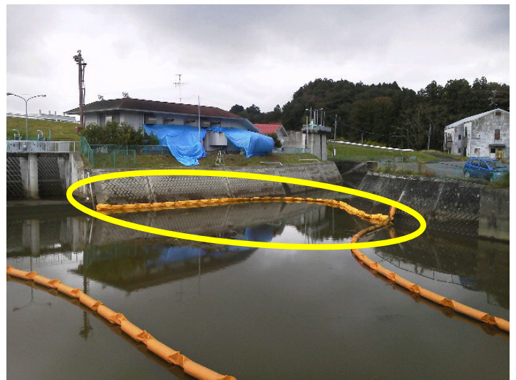
排水機場流入池へのオイルフェンスの追加設置完了 (建物奥側が鳴瀬川)