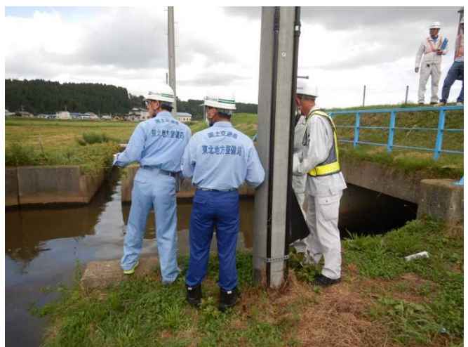
排水樋門の点検状況