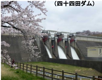
クレストゲートからの点検放流状況