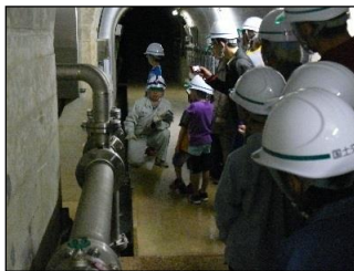
監査廊(ダム内部)見学の様子