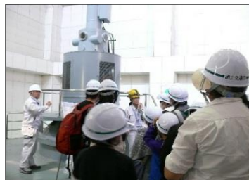
四十四田発電所見学の様子