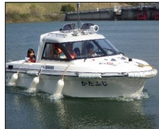
ボートに乗ってダム湖の巡視体験