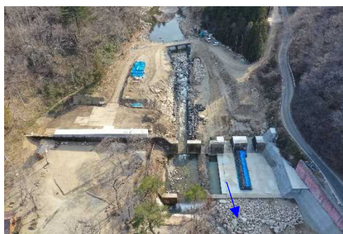
不動尊砂防堰堤（改築）