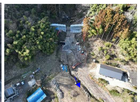
大畑沢砂防堰堤（新設）