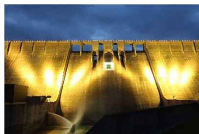
【-昨年の津軽ダム 夏のライトアップの一例】

浅瀬石川ダムではビーバーのあっちゃんが、津軽ダムではクマゲラのペッカー君が夏景色を満喫しております。皆様のお越しをお待ちしております。