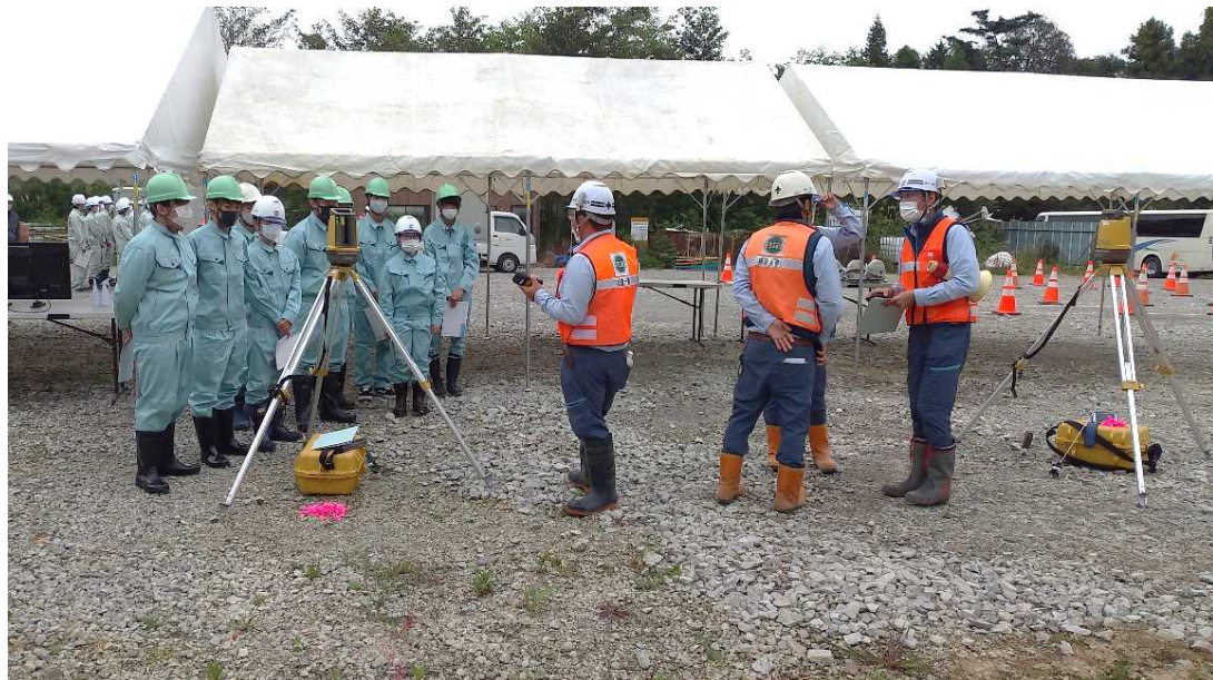
測量器械を使った測量体験