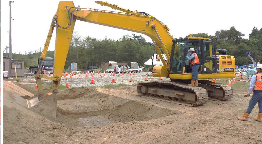
バックホウ操作体験