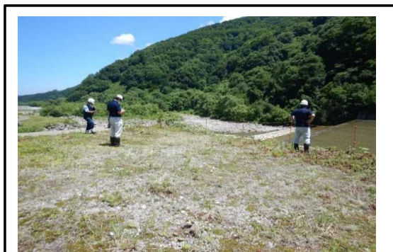
立谷沢川流域 南部山村広場での点検状況