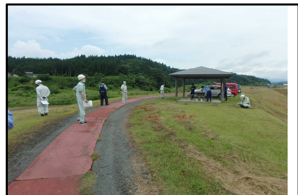
鮭川出張所管内 水辺の楽校での点検状況