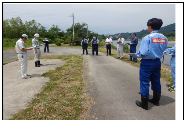
最上南部流域治水出張所管内 本合海水辺プラザでの点検状況