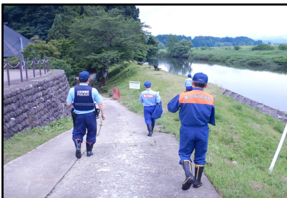
鮭川出張所管内 観音寺親水護岸での点検状況