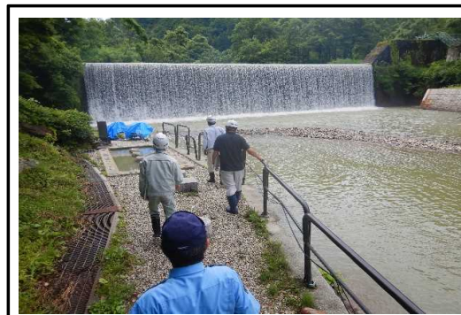
角川・銅山川流域 肘折砂防堰堤での点検状況