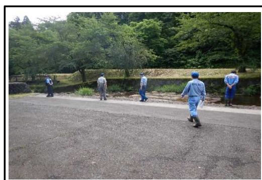
赤川流域 ワインパーク戸沢での点検状況