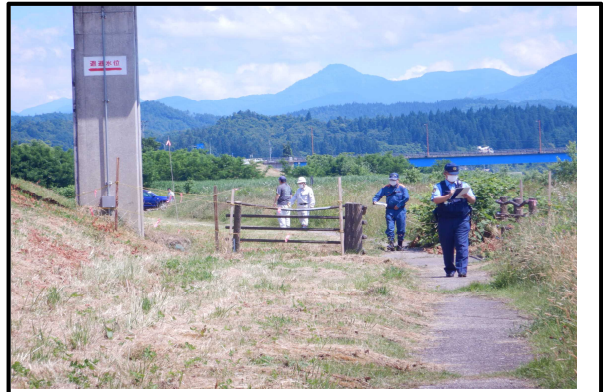
大石田出張所管内 親水公園での点検状況