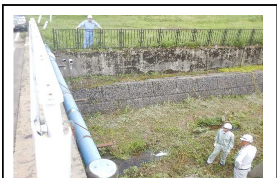
寒河江川流域 後沢導流工での点検状況