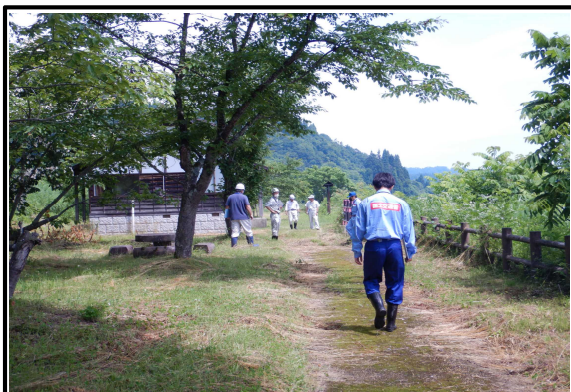
最上南部流域治水出張所管内 船着場(渡船資料館)での点検状況