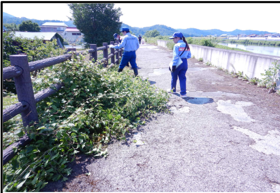
大石田出張所管内 横山特殊堤での点検状況