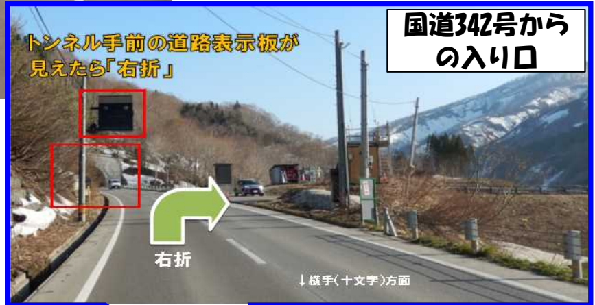
国道342号から の入り口