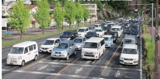
② (主) 福島吾妻裏磐梯線「あづま陸橋東交差点」