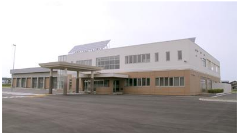
小川原湖交流センター宝湖館