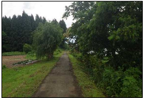
○枝を剪定しました