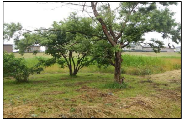
○枝を伐採しました