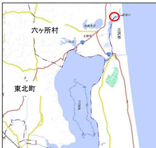
この地図は、国土地理院の承認を得て、同院発行の電子地形図(タイル)を複製したものである。【承認番号 令元情使、第415-GISMAP43081号】