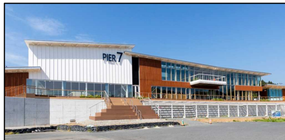
気仙沼市まち・ひと・しごと交流プラザ「ウマレル」(PIER7)