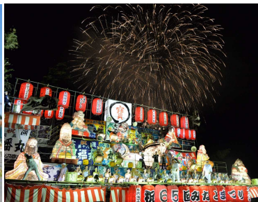
気仙沼みなとまつり