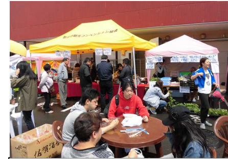
気仙沼みなとでマルシェ。