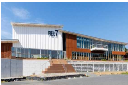
【代表施設】気仙沼市まち・ひと・しごと 交流プラザ『ウマレル』(PIER7)