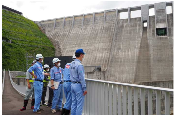
維持工事担当者との点検(白神が故郷橋パーク)