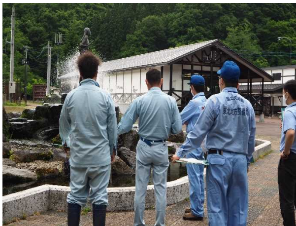
占有者との点検(ふれあいの広場(虹の湖公園))