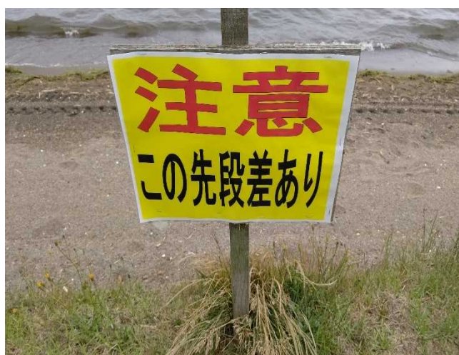
注意喚起看板の更新(措置完了)