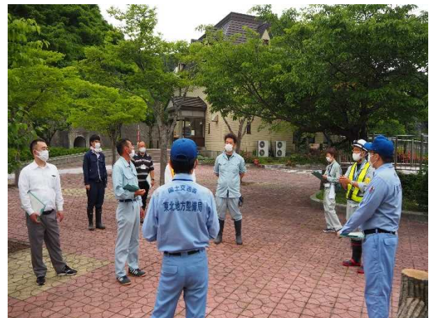
占有者との点検(ダムサイト公園)