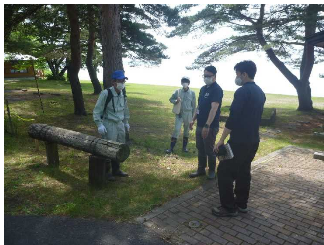
占有者との点検(三沢湖水浴場)