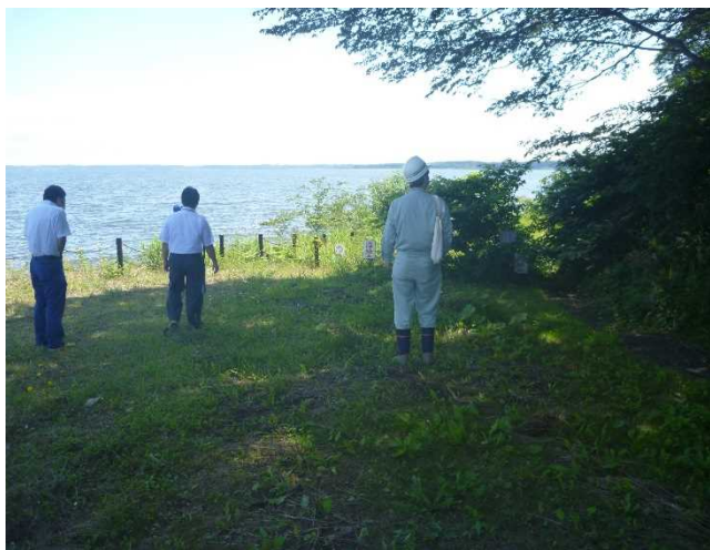
占有者との点検(小川原湖公園)