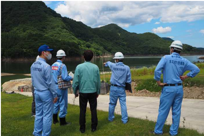
占有者との点検(津軽白神湖パーク)