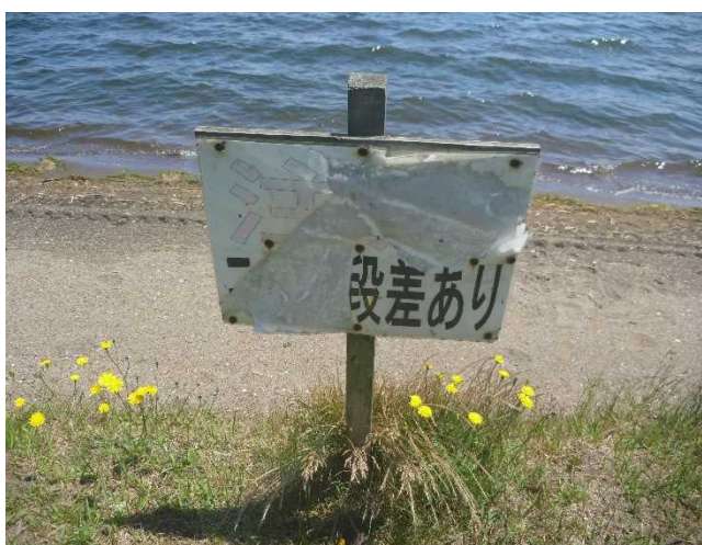
公園内の段差注意喚起看板の腐食