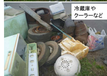
冷蔵庫やクーラーなど