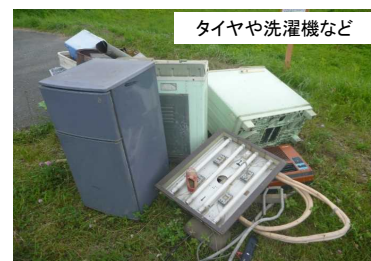
タイヤや洗濯機など