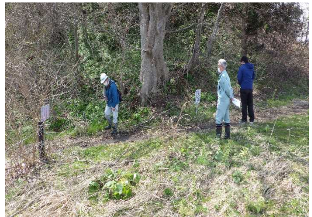
占有者との点検(小川原湖公園)