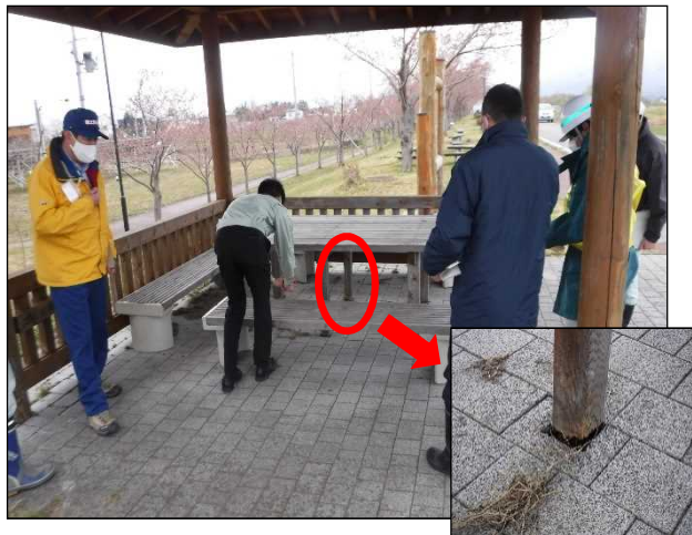
東屋のテーブル脚腐食