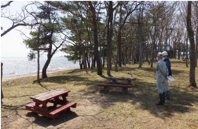
占有者との点検(ワカサギ公園)