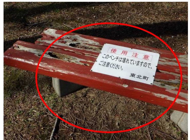
4月20日 貼り紙により注意喚起措置完了