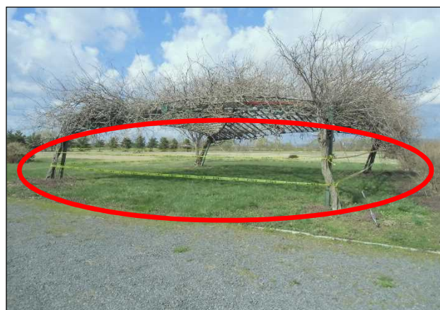
4月15日 立入禁止措置完了