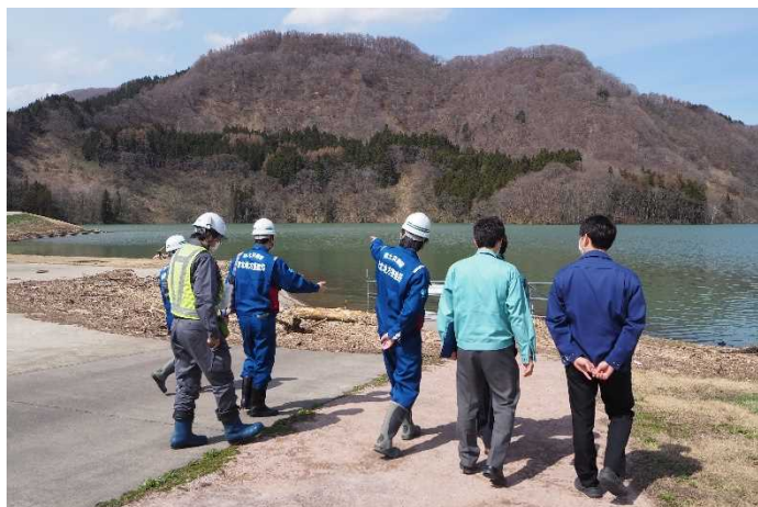
占有者との点検(津軽白神湖パーク)