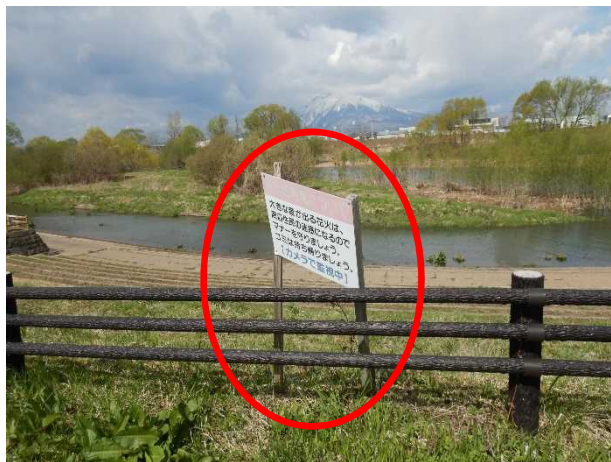
注意喚起看板の破損