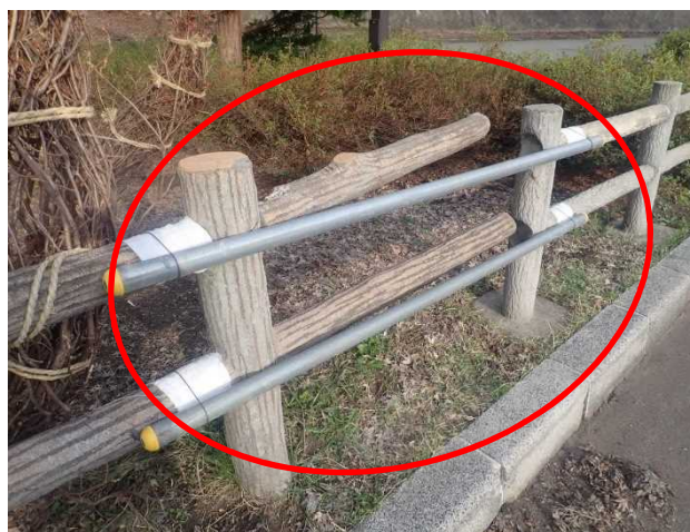
4月16日 単管による応急措置完了