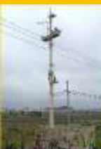
スピーカ増設 (八反田警報所)

平成30年7月に発生した西日本豪雨を受け、「異常豪雨の頻発化に備えた、ダムの洪水調整機能に関する検討会」での提言を踏まえ、ダム下流の住民等への確実な情報周知を図る必要があるため、浸水想定区域内に位置する警報所の嵩上げやスピーカを増設する対策をおこなってます。