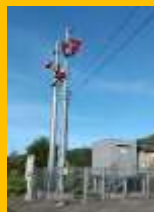
スピーカ増設 (村市警報所)