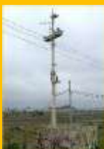
スピーカ増設 (八反田警報所)

平成30年7月に発生した西日本豪雨を受け、「異常豪雨の頻発化に備えた、ダムの洪水調整機能に関する検討会」での提言を踏まえ、ダム下流の住民等への確実な情報周知を図る必要があるため、浸水想定区域内に位置する警報所の嵩上げやスピーカを増設する対策をおこなってます。