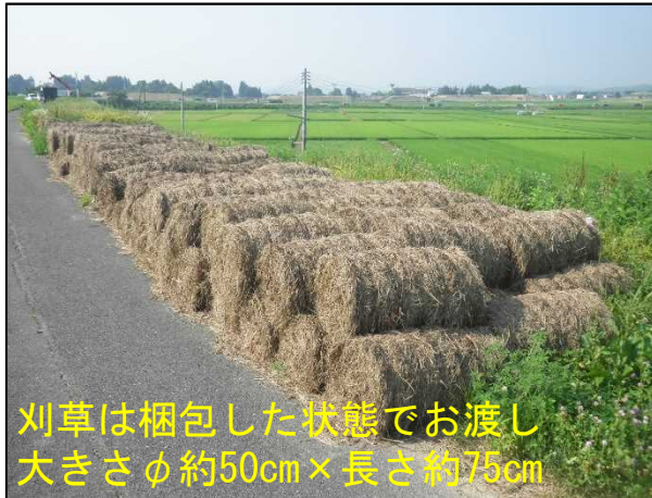
⑤梱包された刈草の集積