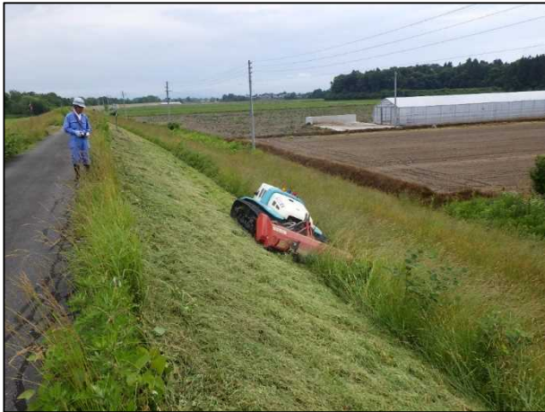
①堤防の除草作業（遠隔操縦式）