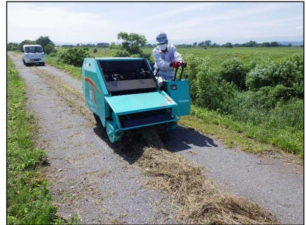
③集草した刈草の梱包作業