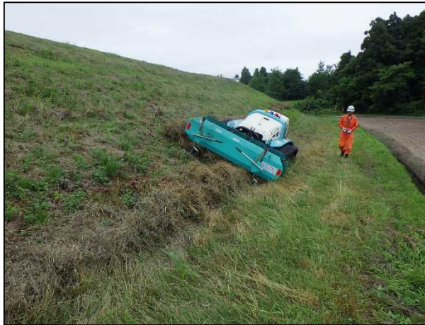
②刈草の集草作業（遠隔操縦式）