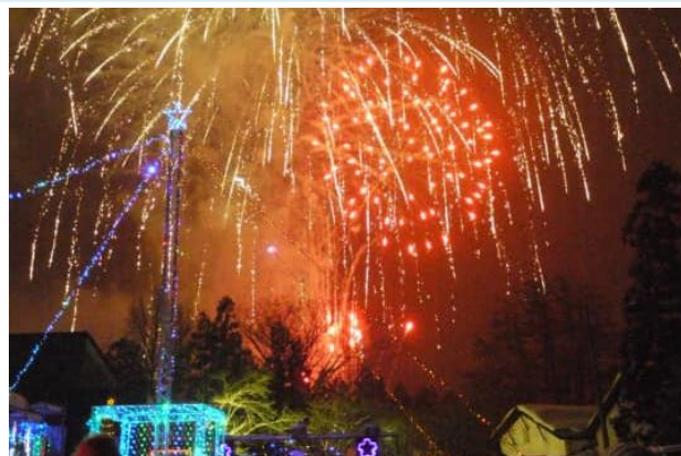
▲浜倉でのイルミネーション花火