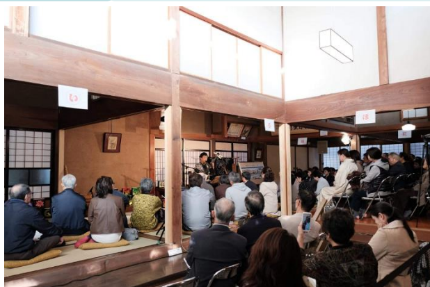
▲日本郷家住宅での三味線演奏会