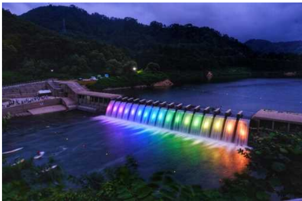
錦秋湖大滝ライトアップの様子（2019）