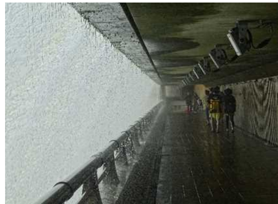
錦秋湖大滝開放の様子（2019）