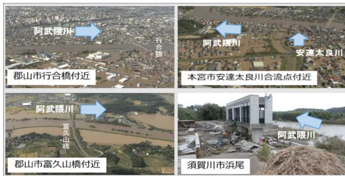
プロジェクト概要図

令和元年10月東日本台風により、阿武隈川では、堤防決壊、越水、溢水により事業所、家屋等の浸水等、甚大な被害が発生しました。また、阿武隈川本川の水位上昇に伴い、支川の氾濫や内水被害等、甚大な被害が発生しました。