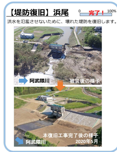
復旧工事の進捗状況

<< 発表記者会：福島県政記者クラブ、福島市政記者クラブ、郡山市記者クラブ >>