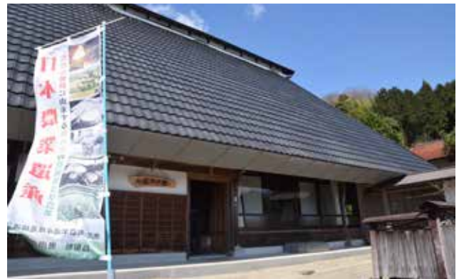
たたら製鉄関連の施設の再利用・修景により、地域に根付いた建物を風景の一つとして活用している。この施設は、農事組合法人が農泊として活動の中心的施設とするとともに、外からの人呼び混んでいる。組合の存在は棚田の良好な維持に重要な役割を果たしている。