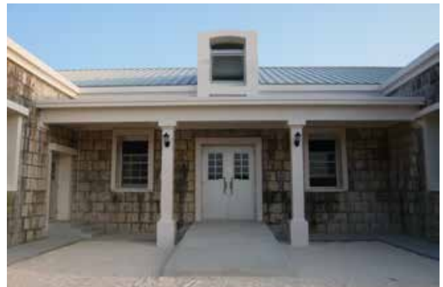
燐鉱山の近代化遺構（旧東洋製糖出張所）を 保存・復元した「りんこう交流館」