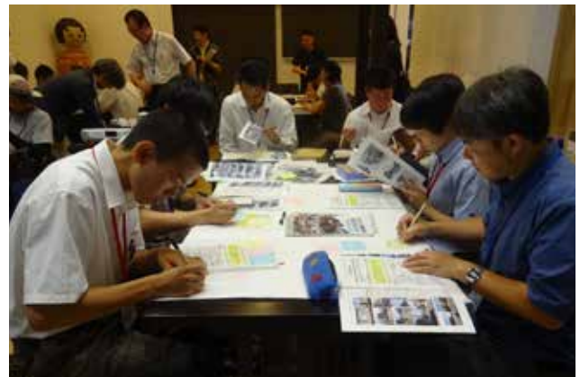
2017年第1回ワークショップの様子