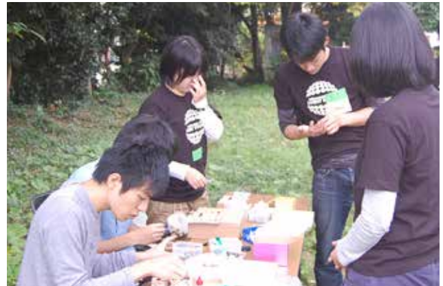
湘南邸園文化祭@藤沢市、旧モーガン邸庭園 大学の研究室による間伐材を用いた時計作成のワークショップの様子