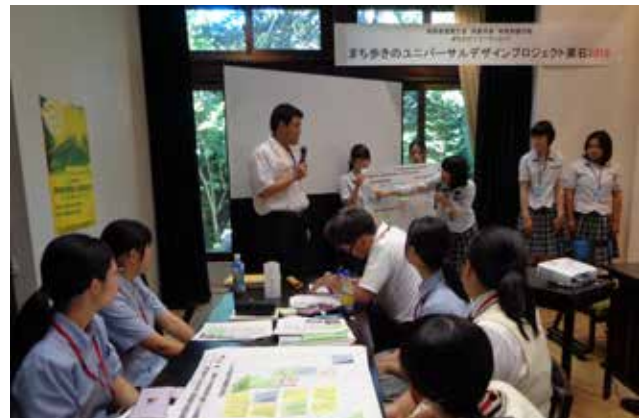
2019年第1回ワークショップ