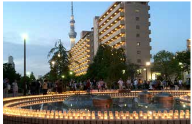
灯のイベントの開催 子供達と一緒にろうそくの火を灯す