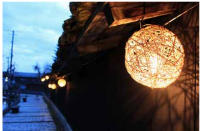
大堰公園に面した住宅の杉板堀に灯るランプシェード 歩行者を誘導し、水路に光が映り込む