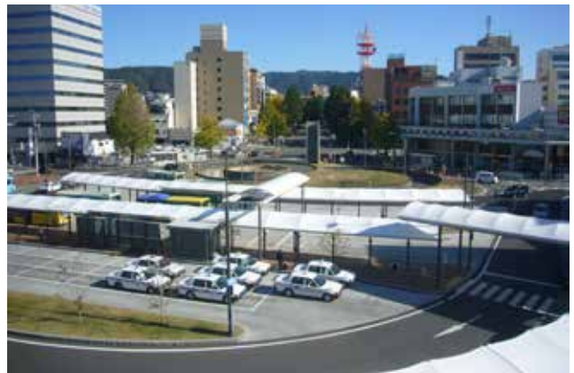
徳山駅前賑わい交流施設から北口駅前広場（写真下）、御幸通（写真中央）を望む