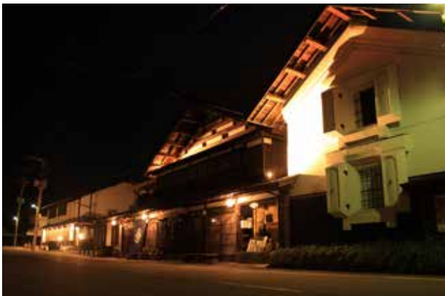
手前は民有地の蔵、中央は店舗兼住宅、奥は銀行 軒下には手作りのランプシェードが灯り、 漆喰の壁面はライトアップされる