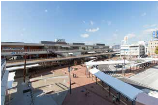
徳山駅前賑わい交流施設（写真中央）と前面に広がる北口駅前広場

戦災により甚大な被害を受けた街はその後の土地区画整理事業によって復興を遂げ、現在の骨格となる街並みを形成してきた。当地区は駅、目抜き通り、商業地区を中心に街の発展を担ってきたが、郊外型大型店の進出などにより空洞化し求心力を失っていた。この状況に取り組むため官と民が横断的に支援、提案、助言など積極的な交流を行ってきた。市は駅の南北自由通路、賑わい交流施設、駅前広場の事業を推進。クオリティの高い中心施設を整備し緑豊かな都市軸とその一帯の景観的連携を実現した。県内で初めて景観整備機構に指定された建築士会は守る、育てる、楽しむをキーワードに景観の保全、色彩のルール、街のアクティビティなどについて提言を続けてきた。中心市街地活性化協議会はマルシェ、クリーンプロジェクト、マナーアップなどに長年取り組んできた。地区の中核を成す賑わい交流施設と駅前広場は巧みに連携したデザインで高い水準にあり、年間 200 万人の来場、280 回に及ぶイベント開催につながっている。このように新旧の施設と継続的な活動が景観形成に大いに貢献していると評価され今回の受賞につながった。(富田)