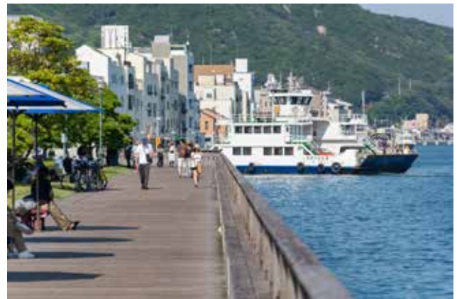
尾道駅前の緑地広場ウッドデッキ整備