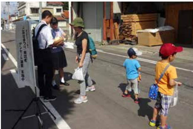
2017年第2回ワークショップ 来訪者視点からのまち歩きバリア探し（歩行者天国での観光客インタビュー）