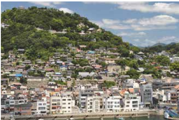
向島から見た尾道市街地の山手斜面地

天与の地形、地の利の上に刻まれた人々の暮らしは変化しながらも続き、今のまちがある。そう考えた時に、「視線の抜け」と「時の蓄積」、この二つが尾道のまちづくりを支える価値として共有されてきたように感じた。展望台とされた場所からの眺めはもちろん、急な上り下りで足元に縛られた目線が解放された時、密集した建物のあわい、駅に降り立った瞬間、視線は抜けてその先にある海、空、山が見える。この感覚が、私は今尾道にいる、という安心と幸せとなる。2度にわたるマンション開発を市民の力が押し留めたことはその証左であり、それを引き継いで景観法による景観地区指定による建物高さ制限や、屋上看板の撤去が進む。これらまちの骨格を整える方策とともに、随所に残る時の蓄積としての歴史的建物、小道の保全と活用がきめ細かく進む。民間の力が発揮される場面である。メニューとしてみれば特段新しくはない。しかしそれらを今、ここでできることとして積み重ねてきた。その成果は尾道の景観に確実に現れている。願わくば、多くの市民に支えられてきたこの景観まちづくりの意思と成果を明示的に記述し、価値の継承と今後の戦略をより確かなものとして欲しい。(佐々木)