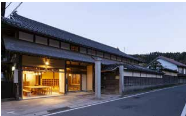
三沢集落にある古い商家を市が中心となって改造した「みらいと奥出雲」。地域コミュニティの活動の場が街に開かれ新たな活力を生み出している。また内部の貸しオフィス区画は満室である。