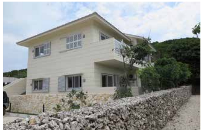
燐鉱山時代の社宅をモチーフに設計した 漁師用の定住促進住宅（通称：うみんちゅ住宅）