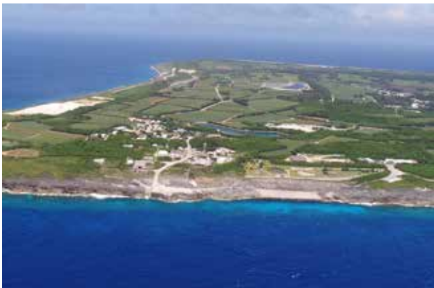
島の西側から見た対象地区（字港周辺） 手前の西港に隣接し、燐鉱山に由来する集落を形成している

北大東島は、珊瑚礁が隆起してできたドロマイト（海水で変容した石灰岩）の土地に海鳥の糞が化石化してできたグアノ（燐を多く含む物質）が堆積しており、大正時代から昭和初期にかけて燐鉱石の採掘が行われていたという歴史をもつ。燐鉱山遺跡と集落の街区構成、およびその周囲に広がる採掘場跡や畑地の景観が今もなお残る地区は平成30年に国の重要文化的景観に選定されており、当時の生産施設や居住施設が残されている。島では、平成17年以降の文化財調査を行って遺構、歴史文化の保全継承に向けた行政、島民、地元団体等による各種の取組が行われており、屋根勾配を緩やかにした建築様式と島の天然資源であるドロマイト石材による組積造建造物や敷地周囲の石垣を基調とする景観は、平成27年策定された村の景観計画に位置付けられ、新たな漁港施設や祭り広場の修景整備、「うみんちゅ住宅」にも引き継がれていること。さらに、一連の景観に対する取り組みは、村のアイデンティティ醸成や定住促進、地域活性化に寄与していることが認められた。以上のことから、優秀賞に相応しいと評価された。（池邊）