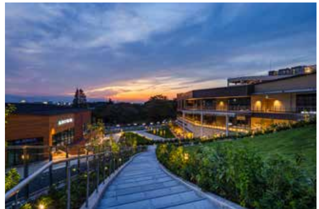
商業施設の屋上緑化から公園と融合する パークプラザと鶴間公園を眺める