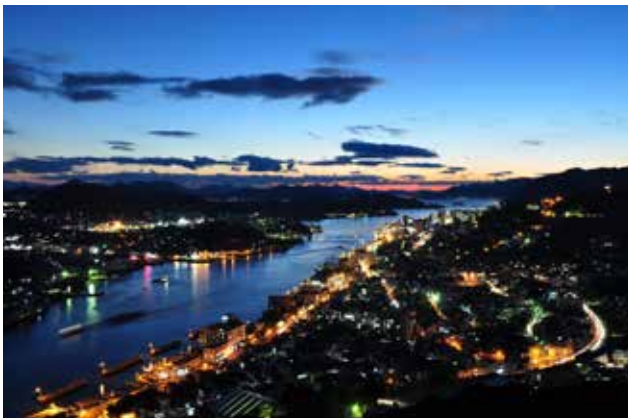
浄土寺山からの夕景