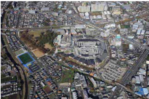
地区全景 官民連携・共同でスーパーブロック化し 駅直結で商業街区と都市公園が融合した

当地区は、既存の商業施設の再整備に伴い、街の構造を全面的に見直し官民一体となってシームレスな街を創った画期的計画である。従前は、ごく一般的な民間鉄道駅に接したアウトレットモールやシネコンなどであり、ショッピング目的の自動車による来街者も多い反面、周辺街区や隣接する都市公園などの関連性は皆無に近かった。こうした状況に対して、既存道路によって大きく分断されていた街区構造を抜本的に見直し、道路の付け替えによって各街区一体的につなげたことは特筆に値する。特に商業と都市公園の間に「パークライフ・サイト」と名付けられた高品質な接続空間を整備したことが、今回の大臣賞評価につながるものとなった。「パークライフ・サイト」はもとも大きな法面と道路によって分断されていた場を、文化施設や市民施設などを整備し連続的な空間としたものである。これによって、従来は訪れる人も稀であった都市公園に活力を与えた。また、これとつながる商業施設においても、周辺街区と平面的に分断されていた駐車場を立体的に再配置し、回遊型ショッピングモールの中に封じ込めた計画は巧みである。今後整備される予定の都市型住宅や複合利用ゾーンの完成によって、更に質の高い都市空間が形成されることを期待したい。（田中）