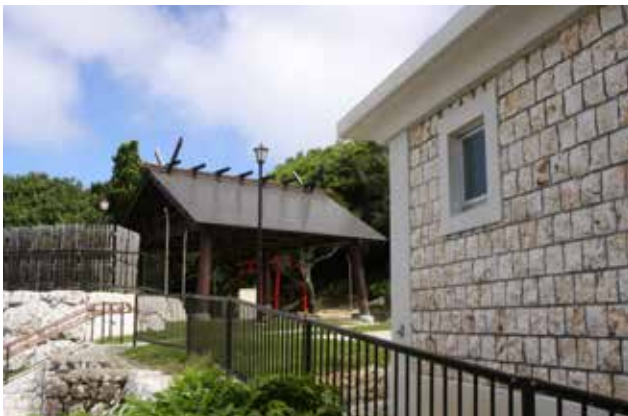
金刀比羅宮の和風の相撲檣と 島産ドロマイト石材を使用したトイレ