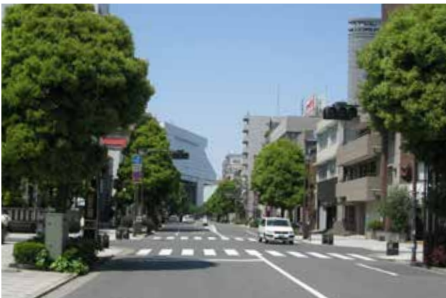
平成 28 年の北斎通り 街路樹、歩道、電線地中化の整備が進む

本活動は、2005年から始まり参加者が多彩で広がりや深まりがある。居住し商売をする方々が積極的にまちを再発見し、新しい都市型コミュニティのかたちを探り、まちにシビックプライド（愛着と誇り）を育むという活動の枠組みはまさに本部門のねらいである。震災・戦災により歴史的町並や建造物を失い、地域遺産ともいべき核になるものがない中で、普通の暮らしの中の生活景を育てあげる活動を通して「暮らしの物語」を紡ぎだしていくプロセスを重視し、成果を生み出している活動である。新たな集合住宅の建設が進み新住民の増えていく過程で、開発指導要綱や集合住宅条例によって「地域コミュニティとの共生」を担保し、地域の誇りをマルチステークホルダー・プロセスとして住民のみならず企業、商店なども参画し、対話を重視して学び合い、さらに愛着を育む活動を静かな情熱で継続してきている。地域コミュニティへの参加促進と古くからの居住者との融合をめざして地域が有する専門性を活かし、さらに将来の地域の人口減少も視野に入れて、景観を切り口に住民の「地域力」を高める当事者性が高く評価された。（小澤）