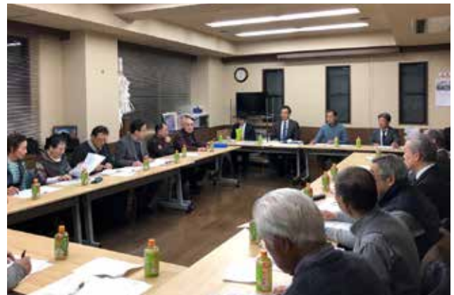
建替え調整協議会 事業者と地域住民と専門家が協議する