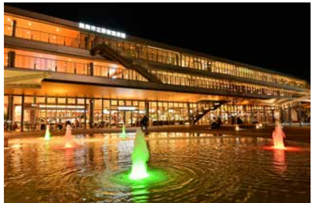
夜のライトアップ 電気は全てコンビナート電力を活用している