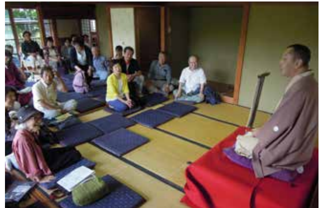
湘南邸園文化祭@横須賀市、万代会館 地域で親しまれる歴史的建造物での寄席の様子