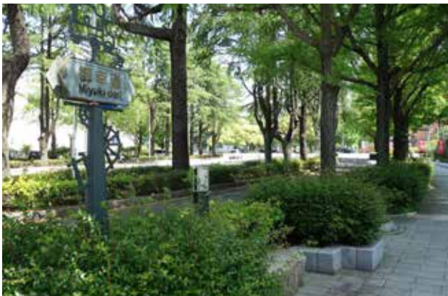
御幸通から市役所方面を望む 豊かな街路樹が四季折々の姿を見せる