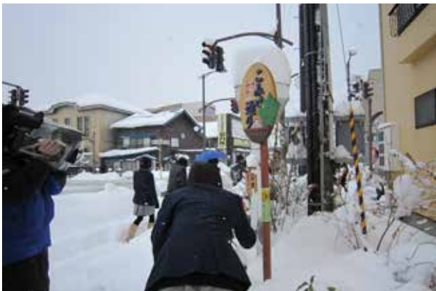
黒石駅の音のでる案内サイン 完成したサインを黒石商業高校の生徒と一緒に体験

青森県建築士会南黒支部は、22年間にわたり、黒石市を代表する伝統的建造物群保存地区の「こみせ（雁木）」をテーマに、行政、商店、市民さらに小・中・高校生とまちづくりコンクールやワークショップを実施する等、様々なまちづくり活動を実施してきた。そして2017、18、19年度には、外国人観光客にもわかりやすい公共サインと民間店舗の屋外広告サインを地元の高校生とデザインし、提案発表した。その提案は、現在進めている黒石市の景観整備事業と共に、今後実現される予定である。高校生の豊かな発想を引き出しながら、黒石らしいユニークでユニバーサルなサイン整備を提案する活動は、歴史的な街並みをさらに魅力的にする試みとして高く評価できる。今後の公共と民間のサイン整備を多いに期待したい。(卯月)