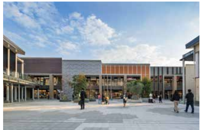
個々に特徴のあるファサードを背に、 シンボルツリーを象徴としたグランベリープラザ