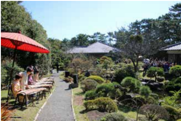
湘南邸園文化祭@葉山町、葉山しおさい公園 庭園でのお琴演奏会の様子

地域に存在する景観資源を発見し、守り、活用するのは景観まちづくりの一般的なアプローチである。しかしその活動の輪を広げて、価値が共有されるまでには多くのエネルギーを必要とする。明治期以来、首都圏で活躍する政財界人・文化人が滞在・交流してきた湘南地域には、その面影を残す邸宅・庭園、街並み、文化が息づいているが、近年の社会状況から存亡の危機に瀕している。その価値の大切さに気づいた市民の皆さんがそれぞれの地域で保存・活用の取り組みを進めている。本活動は、そうした個別の活動の自立性を前提にしながらネットワーク化し、多くの人に湘南の歴史や文化をわかりやすい形で示している。相互の情報交換によって個別活動の工夫も共有されているという。広域的な地域の価値を高めることに成功したこの活動は非常にユニークであり、他の地域はもとより、今後の景観政策に与える示唆が極めて大きい。市民の活動をベースにした本活動が継続していくことを期待したい。（福井）