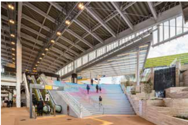
グランベリーパークへ向かう大階段と 植栽・水景エリアでまちの高揚感を演出した駅のホーム