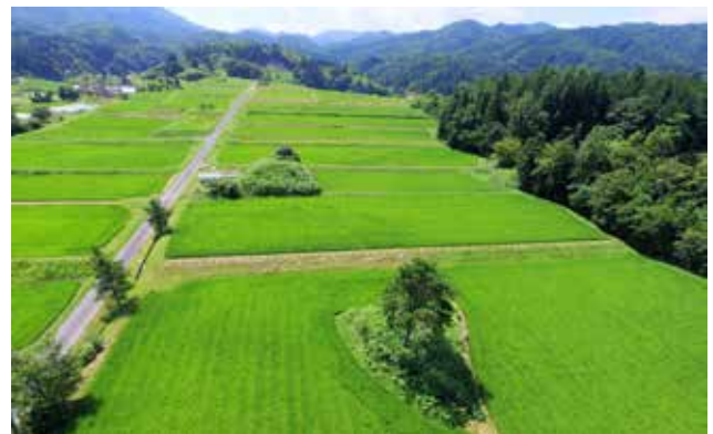
砂鉄採取跡地を再生した棚田の大きな特徴として、砂鉄を採取するため大地を削る際に、祠や墓地、ご神木などの重要な場所を削らずに残したため小山のようになった「鉄穴残丘」があり、奥出雲の景観をユニークなものとしている。