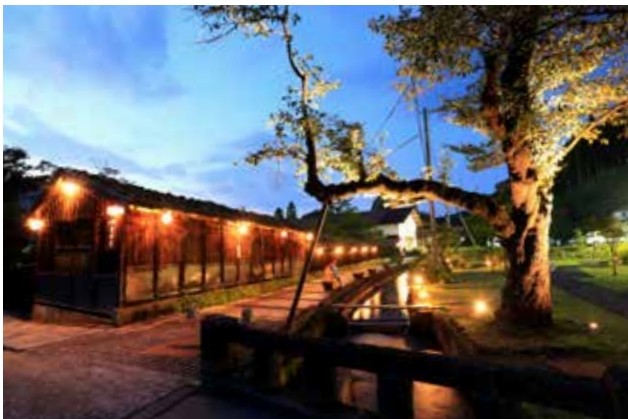
金山町の景観の象徴でもある大堰公園周辺の風景 水路（大堰）沿いの光と保存樹の光

50年以上にわたって街並み景観づくりに取り組んできた金山町は、公民連携、大学との協働、地場産業との関わりなど、常に最先端を走ってきた。本活動における夜間景観づくりはそれをさらに前に進めるものである。全額補助のワークショップではじめてのランプシェードの製作は、人づてに技術が伝承され、いまや役場では正確な設置数わからないという。金山住宅を普及させたこの地らしい話である。住民の方に話を聞くとひとつひとつの照明に思い入れがある。東京から来た学生は照明設置や維持管理をサポートし、全体計画や公共施設への光設置を担っており、住民と大学との協働関係が成立している。手づくりのランプシェードは街灯と違って人の気配を感じさせる。訪問した日は冷たい雨がふる暗い夜だった。雨で光る路面に反射した小さな灯りの群れは、街並みを明るく照らすほどではなかったが、金山のみなさんの暖かさや美意識を表しているようだった。(福井)