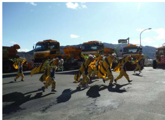
園児によるへいたっこ虎舞