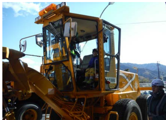
除雪機械体験中の園児