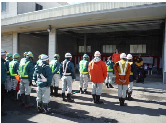
施工業者による安全宣言