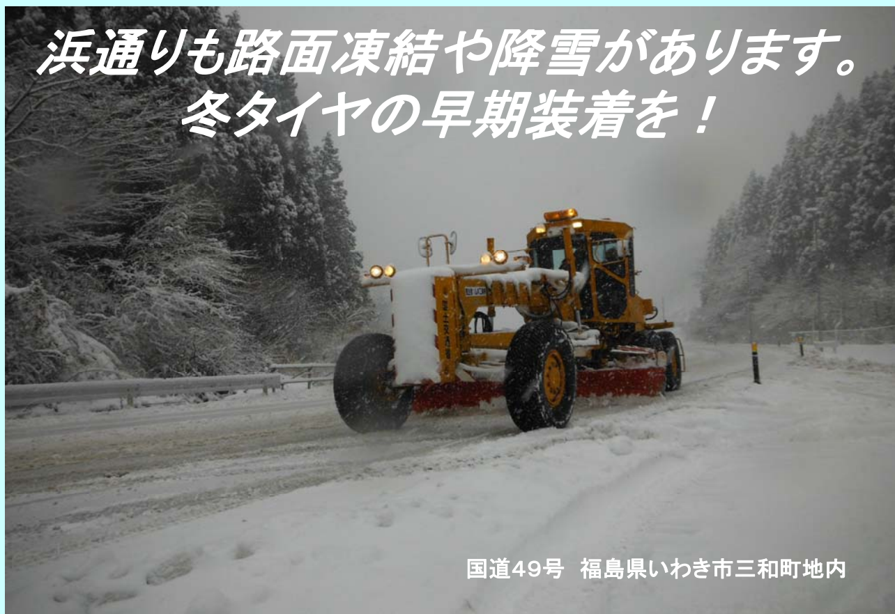
国道49号 福島県いわき市三和町地内