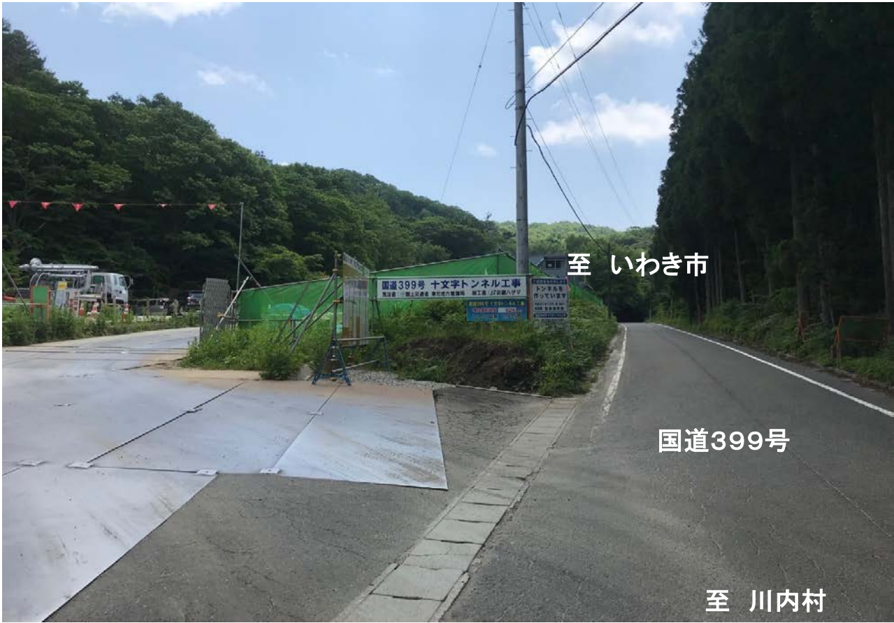
国道399号 十文字トンネル工事 現場詰所入口(川内村方面から撮影) (川内村側の坑口前)

「この地図は、国土地理院長の承認を得て、同院発行の電子地形図(タイル)を複製したものである。(承認番号 平29東複、第33号)」