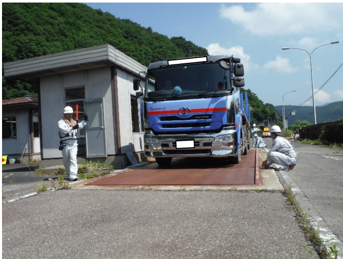
猪苗代車両検測所