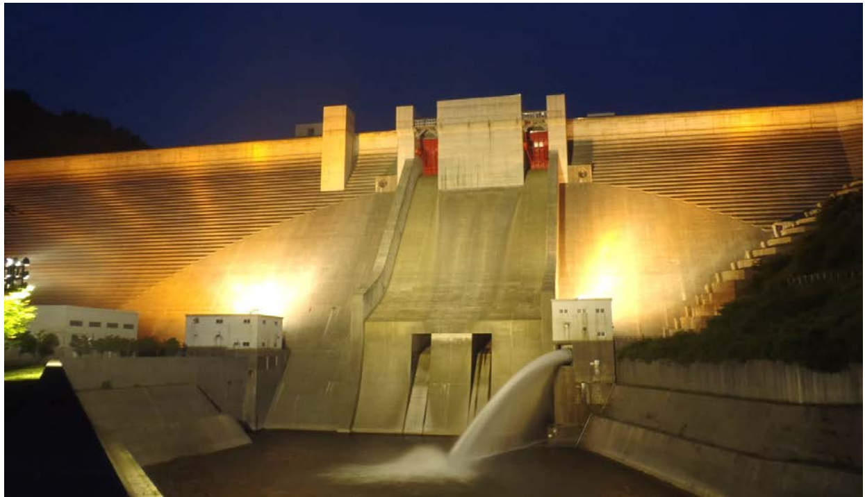
～ 夜のダム 浮かぶ月模様 ～