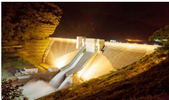
【H28ライトアップ状況】

8月から9月に行われる地域の主要なイベント等に合わせて、 月山ダムのライトアップ を実施します。