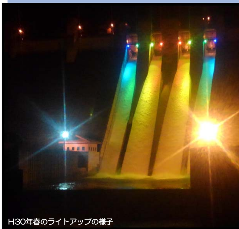
H30年春のライトアップの様子

浅瀬石川ダム“夏のライトアップ”は、『森と湖に親しむ旬間(毎年7月21日～31日)』の期間に合わせ実施します。浅瀬石川ダムの定番カラー“浅瀬石川ダムレインボー”で、涼やかにダム堤体を照らし出します。