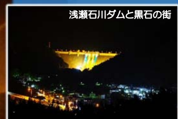
浅瀬石川ダムと黒石の街