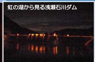
虹の湖から見る浅瀬石川ダム