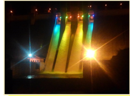
【H30年春のライトアップの様子】

浅瀬石川ダムのライトアップは、夏の心地よい夜風を感じながら楽しめる見どころスポットがたくさんありますので、是非お越しになり竣工30周年という記念すべき節目の年を迎える浅瀬石川ダムを盛り上げて下さい。