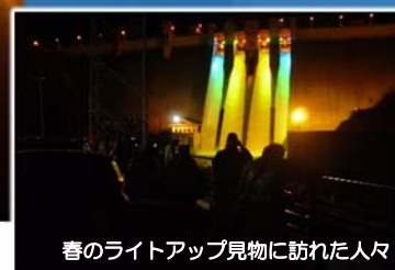
春のライトアップ見物に訪れた人々