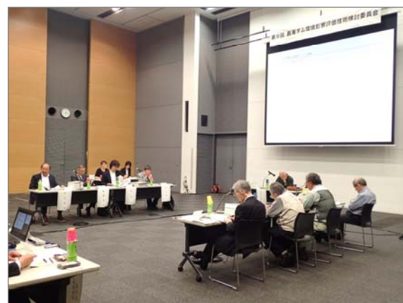
委員会の開催状況