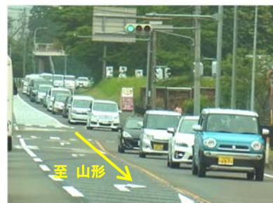
▲H29 さくらんぼ狩り期の混雑状況

今年も山形県東根市や天童市と連携した出発時間変更を促す取組みを継続するほか、広報の拡充、交差点の交通容量拡大策を実施して混雑緩和を図ります。