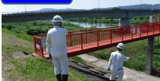
点検及び被災状況の報告