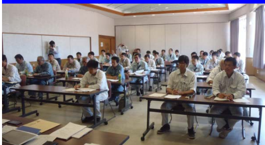
5/29 講習会の状況 (伊達ふれあいセンター)