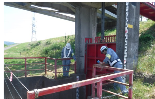
点検及び被災状況の報告