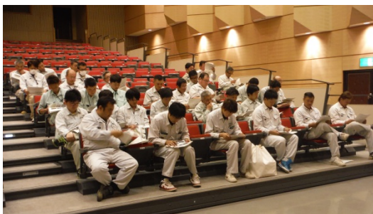
5/31講習会の状況 (サンライズもとみや)