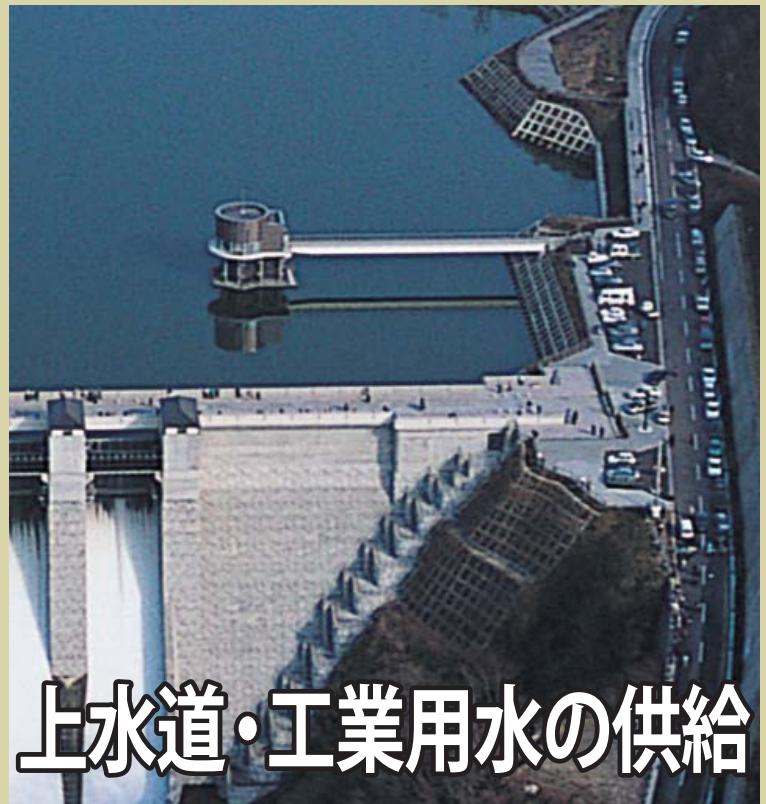
上水道・工業用水の供給