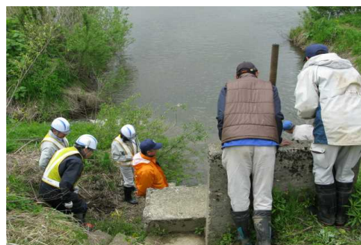
昨年度の点検状況（ニッ井出張所管内）

点検の結果、異常箇所が確認された場合には、その是正についての指導、助言を施設管理者に行い、改善を進めます。