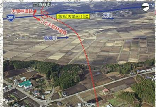
(仮称)上北(2)IC付近から(仮称)天間林(1)ICを望む