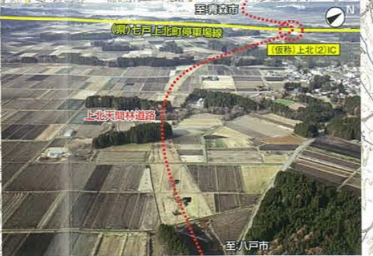
上北天間林道路起点付近から(仮称)天間林(1)ICを望む