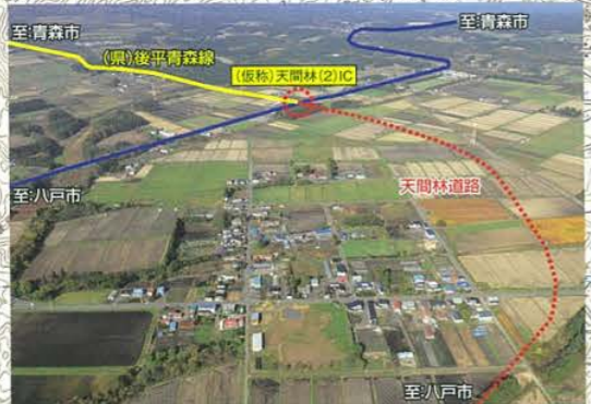
(県)乙供停車場中野線付近から(仮称)天間林(2)ICを望む