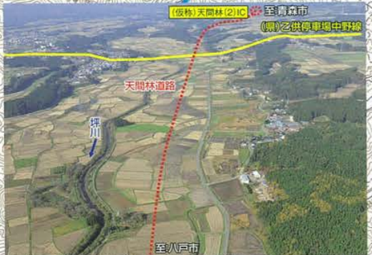
(仮称)天間林(1)IC付近から(仮称)天間林(2)ICを望む